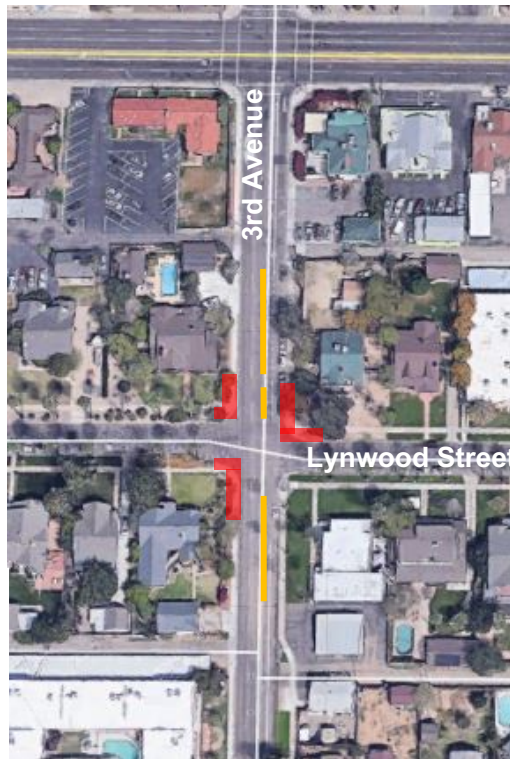
Mapa de Ubicación del Sitio

Favor de emplear precaución al viajar por las zonas de construcción. Haremos lo posible para reducir al mínimo las interrupciones.