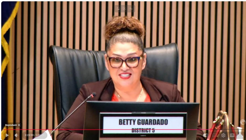
Phoenix City Council Policy Session - May 19, 2026

El 19 de mayo, voté con orgullo a favor del presupuesto de la Ciudad de Phoenix para el año fiscal 2026–2027 , un presupuesto que realmente refleja las prioridades y las voces de nuestros residentes. Durante este proceso, escuché a muchas personas que asistieron a las reuniones comunitarias, enviaron correos, llamaron a mi oficina o compartieron sus preocupaciones directamente. Su participación ayudó a formar este presupuesto, y quiero agradecerles sinceramente por su compromiso con construir un Phoenix más fuerte.