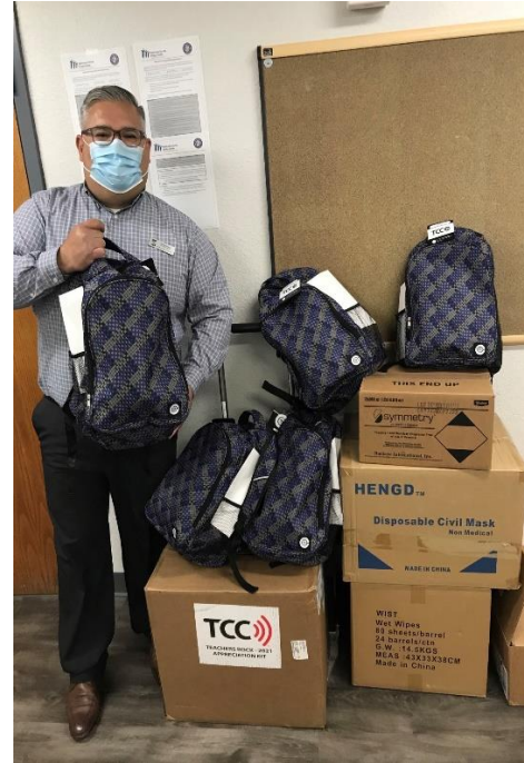
Director de la escuela primaria Villa de Paz

El 25 de marzo, entregamos una caja de 2,000 mascarillas, útiles escolares, mochilas y PPE esencial a cada una de las 20 escuelas en los distritos escolares de Pendergast y Cartwright, además de una entrega al Distrito Escolar Primario de Washington. Continuaremos apoyando a nuestros educadores, personal, estudiantes y sus familias.