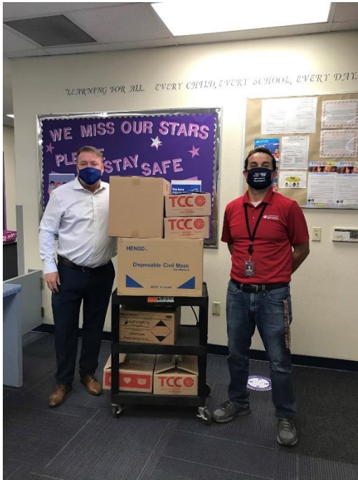
Director de la escuela intermedia Estrella