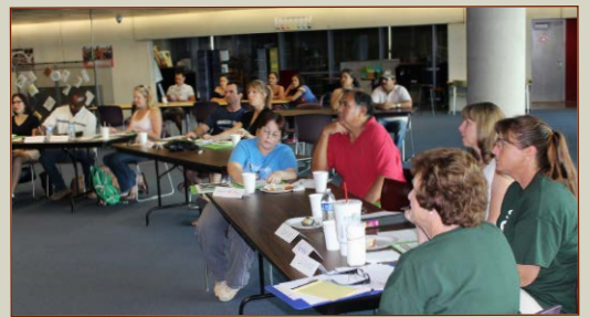
Residentes participaron en Neighborhoodology a principios de este año.

participan en el programa. Para finales de este año, más de 30 líderes de la comunidad provenientes de ocho organizaciones vecinales habrán cumplido con Neighborhoodology de la universidad vecinal.