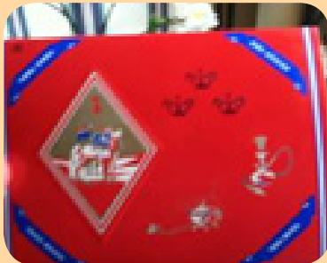
ပန်းပေါင်းနံ့ သာနှင့် အချို့သော ဖယောင်းတိုင်စိုက်သည့် တိုင်များ တွင် ခဲသတ္တုများ ပါဝင်နိုင်သည်။ ခဲသတ္တုသည် မီးသွေး၊ "unsi" နှင့် သင့် အိမ်တွင် အသုံးပြုသည့် အခြားသော ပန်းပေါင်းနံ့ သာနှင့် အချို့သော ဖယောင်းတိုင်မီးစာများအထဲတွင် ပါဝင်နိုင်သည်။