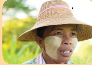
Thanaka (သနပ်ခါး) သည် နေရောင်ခြည်အပူကာရန် နှင့် အသားအရေအား ကာကွယ်ရန် အပင်များမှ ထုတ်လုပ်သည့် မြန်မာလိမ်းဆီ သို့မဟုတ် အရည်ပျစ် တစ်ခုဖြစ်သည်။

စဉ့်သုတ်ထားသည့် မြေအိုးမြေခွက်တွင် ခဲပါဝင်နိုင်သည့်အတွက် အစားအစာ ထည့်သွင်း ပြင်ဆင်ရာတွင် သို့မဟုတ် တည်ခင်းဧည့်ခံရာတွင် ၎င်းကို အသုံးမပြုသင့်ပါ။