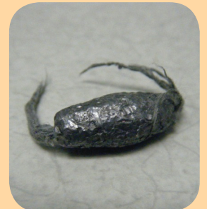
ရွှေ သို့မဟုတ် ငွေချပ် တို့အပါအဝင်၊ လက်ဝတ်ရတနာခါတ်သတ္တု များတွင် ခဲသတ္တုပါဝင်နိုင်သည်။ ကလေးများ လက်ဝတ်ရတနာသတ္တု အား မိမိတို့ပါးစပ်အထဲသို့ ဘယ်သောအခါမျှ မထည့်သင့်ပါ။

ခဲတုံ့- နယူးယောက်မြို့ ကျန်းမာရေးဌာန (New York City Department of Health)