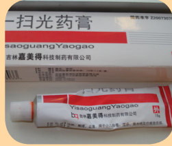
Yisaoguang Yaoguo သည် အင်ပြင်အဖုအသားအရေ ကုသမှုအတွက် တရုတ်နိုင်ငံမှလာသည့် လိမ်းဆေးတစ်ခုဖြစ်သည်။

ရိုသေလေးစားဖွယ်အပြင်များရှိသည့် နယူးယောက်မြို့ ကျန်းမာရေးဌာန ဆိုင်ရာ အမေရိကန်ပြည်ထောင်စုနိုင်ငံ အပြင်ပိုင်းမှ လာသော ခဲသတ္တု ပါဝင်သည့် လိမ်းဆေးများနှင့် ဆေးရည်ပျစ်များ -