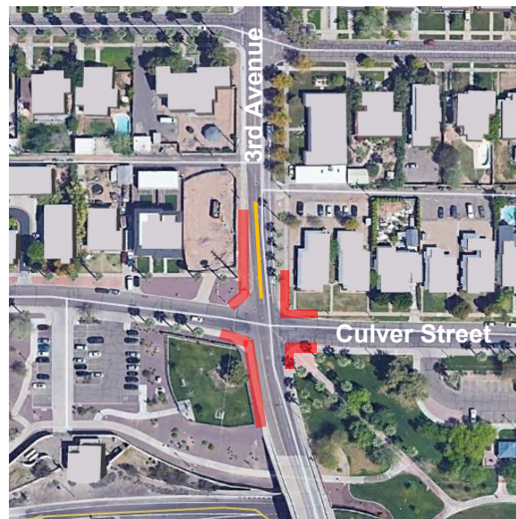
Mapa de Ubicación de la Obra

Favor de emplear precaución al viajar por las zonas de construcción. Haremos lo posible para reducir al mínimo las interrupciones.